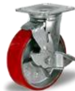
C-4102-DUS (полиуретан) поворотное с тормозом

При оптовых закупках предоставляется скидка до 20%