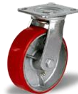
C-4102-DUS (полиуретан) поворотное без тормоза